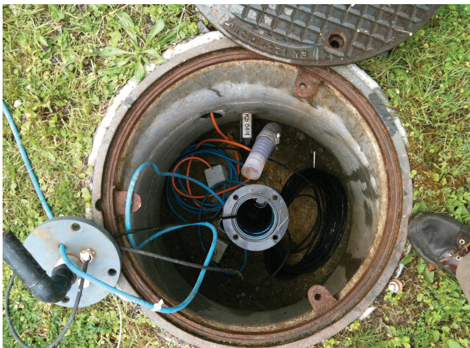
Schacht mit Sanierungsbrunnen (Mitte), Leitungsrohr für Permanganat-Injektion oder Extraktion (oben) und elektrische Zuleitung für Pumpe.

Aufgrund der wiederum durchgeführten Evaluation möglicher Sanierungsmethoden erwies sich die sog. ISCO-Methode (= in-situ chemical oxidation) als am geeignetsten. Eine Schadstoffentfernung mittels des für den ersten Herd angewandten Auskofferns erwies sich wegen