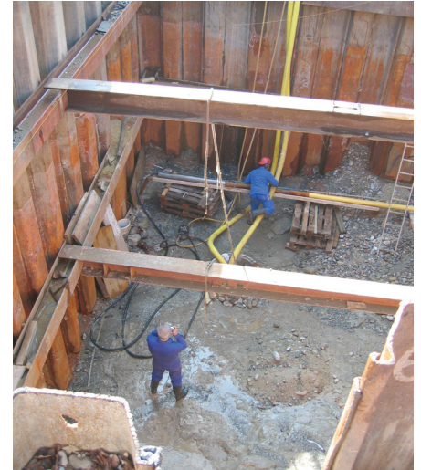
Baugrube mit freigelegter Feldoberfläche (Vordergrund). Hinten rechts Schotter aus grobem Kies vor dem Aushub.

Nach eingehender Untersuchung und Prüfung wurde eine Dekontamination mittels Auskoffern der betroffenen Zone bis auf den Fels beschlossen, um die behördlich verordnete Grundwassersanierung zu realisieren. Die mittels Spundwand umschlossene Baugrube mass ca. 8 x 12 m und war rund 6 m tief. Sämtlicher Kies wurde bis auf den Fels ausgehoben und, soweit belastet, speziell entsorgt (Abb. 1).