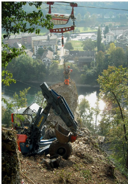
01 Die obersten Meter werden wegen akuter Absturzgefahr von Hand abgebaut. Der Felsturm war in dieser Phase mit Drahtseilnetzen eingepackt. Das Personal ist am Seilkran gesichert