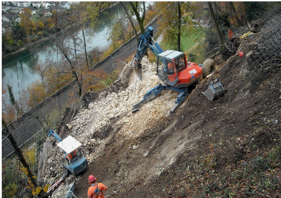
02 Der mechanische Felsabtrag erfolgte mittels Schreitbagger und Hydraulikhammer. Die obersten 12 m des Felspfeilers, die von Hand mittels Presslufthammer abgetragen wurden, sind hier bereits entfernt. Eine Seilbahn erschloss die Baustelle an exponierter Lage (Fotos, Plan und Diagramm: Geotest AG)

Im Februar 2006 stürzte bei Olten ein Gesteinspaket in den Gleisbereich der SBB und beschädigte die Fahrleitung. Da weiterhin mit Steinschlag gerechnet werden musste, veranlassten die SBB langfristige Schutzmassnahmen. Der Abtrag eines instabilen Felsens erfolgte vor einem Jahr, seither sind keine Betriebsunterbrüche infolge Felssturz mehr zu verzeichnen.