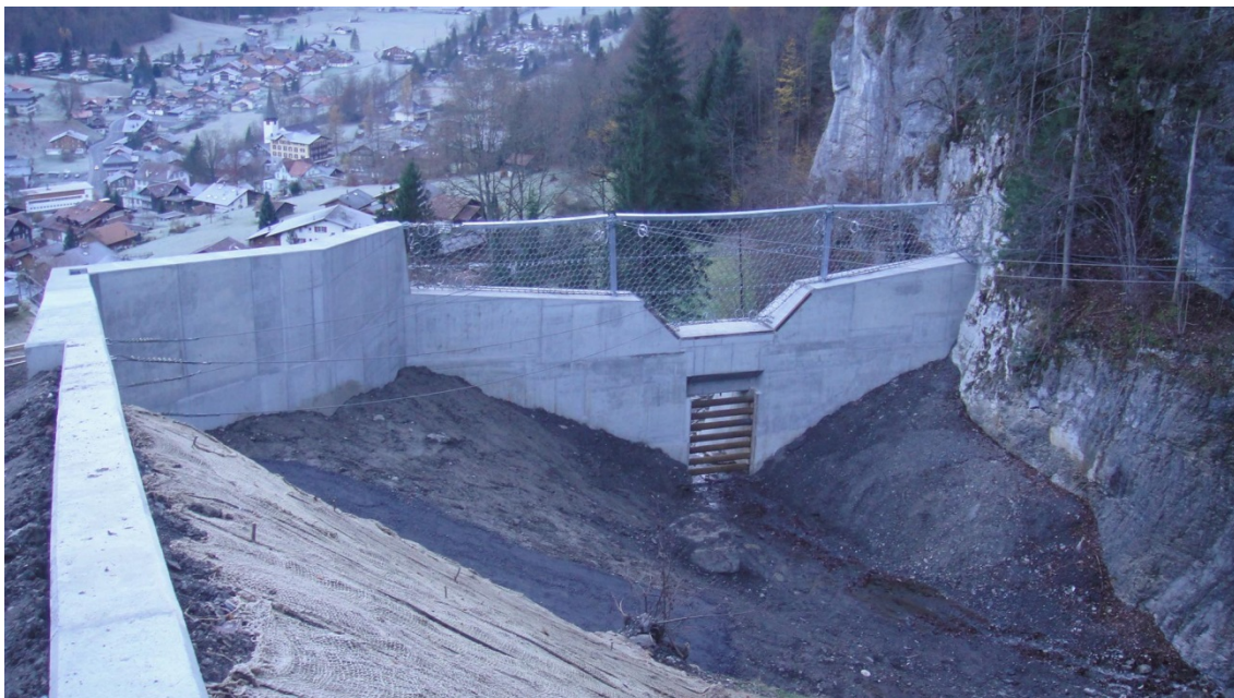
Abb. 2: Rückhalteraum des erweiterten Geschiebesammlers nach Fertigstellung

Berechnungen zum Geschieberückhaltevolumen ergaben, dass die 4,00 \text{ m} hohe Abschlussperre (Projekt V/2002) um 8,00 \text{ m} erhöht werden musste. Aus statischen und ökonomischen Gründen wurde diese Erhöhung mit 4,00 \text{ m} Ort beton und einem 4,00 \text{ m} hohen Murgang-Rückhaltenetz realisiert (Abb. 2).